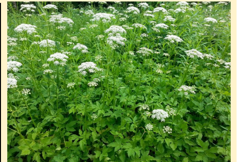
Égopode podagraire ou Herbe aux goutteux **