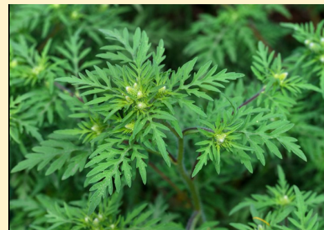
Herbe à poux