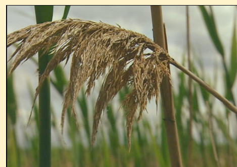
Phragmite ou Roseau commun