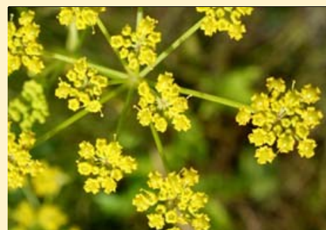
Panais sauvage *