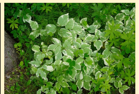
Égopode podagraire ou Herbe aux goutteux ** type panaché