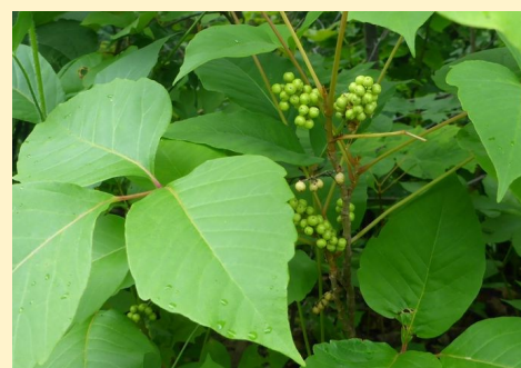
Herbe à puces *