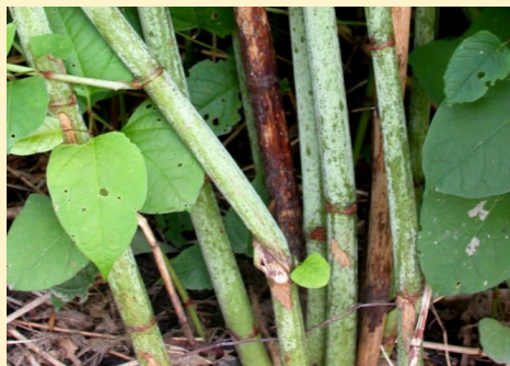
Renouée du Japon

Voici quelques plantes nuisibles ou envahissantes souvent rencontrées :